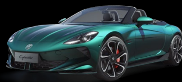
Zelená Mystic Metalický lak 25 000 Kč