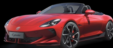
Červená Diamond Metalický lak 25 000 Kč